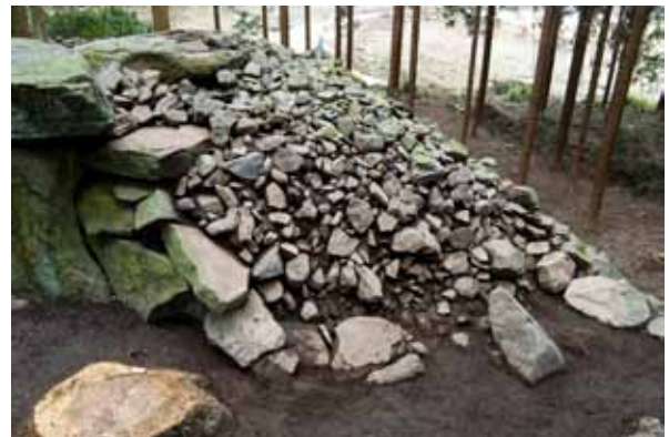
写真6 33号墳 H23-02区 調査実施状況