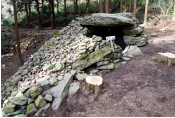
写真1 33号墳 H23-01区 調査着手以前