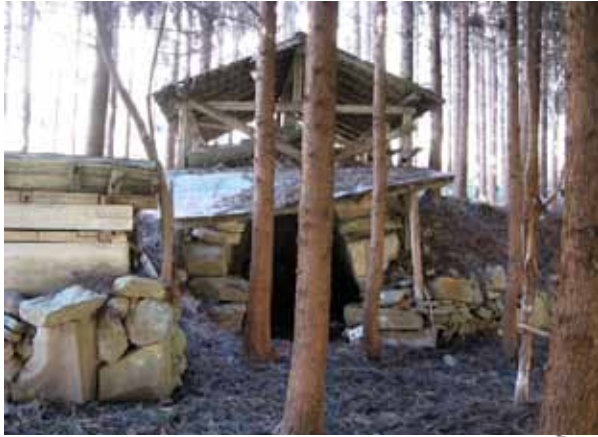
写真7 31号墳 調査着手前

ど含まない墳丘盛土層が確認されました。固く叩き締められた盛土層は大室古墳群では非常に珍しい構造となります。また、調査区の西端部では墳丘盛土層の延長線上に比較的大ぶりの石材が列をなして検出され、墳丘端部付近を巡る石列とみられます。