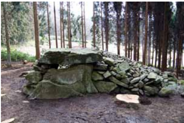
写真5 33号墳 H23-02区 調査着手前