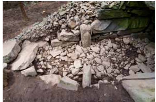
写真4 33号墳 H23-01区 調査実施状況