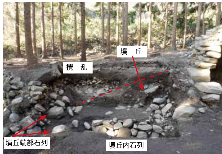
写真8 31号墳 コンクリート構造物撤去地点 調査実施状況

史跡大室古墳群 平成24年度古墳見学会 資料 平成24年6月9日(土) 長野市教育委員会 文化財課 大室古墳群保存会