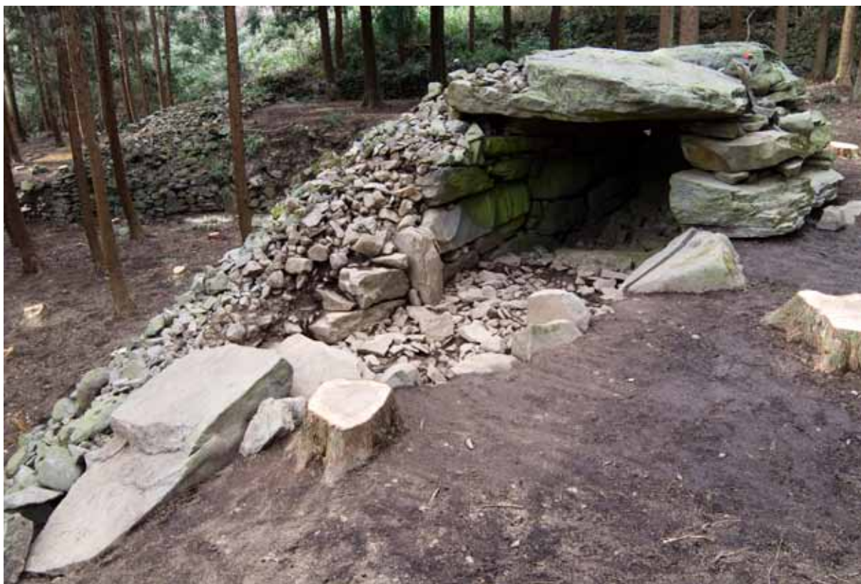
大室 33 号墳 発掘調査実施状況