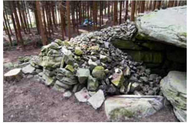
写真2 33号墳 H23-01区 調査着手以前