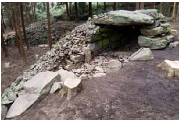
写真3 33号墳 H23-01区 調査実施状況