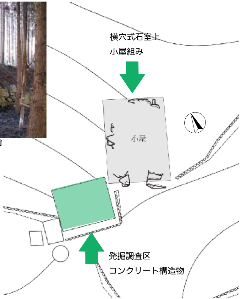
図1 31号墳調査区位置図